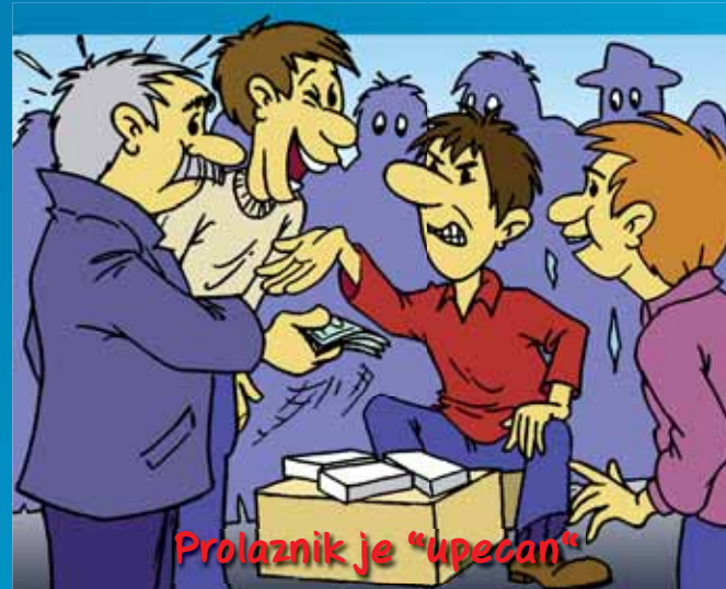
Prolaznik je "upecan"

U jednom trenutku voditelj igre "povuče" kuglicu među prste ili vještom manipulacijom navede građanina na krivu kutiju.