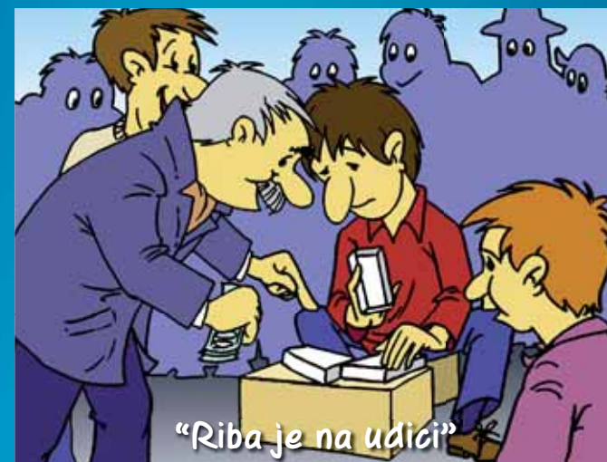
"Riba je na udici"