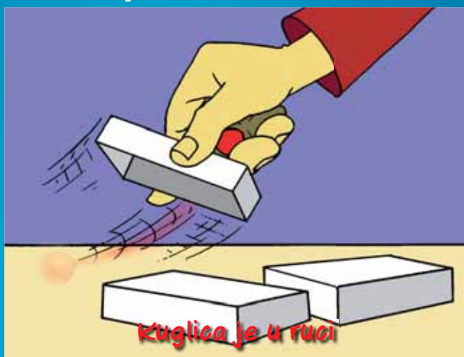
Kuglica je u ruci

U jednom trenutku voditelj igre "povuče" kuglicu među prste ili vještom manipulacijom navede građanina na krivu kutiju.